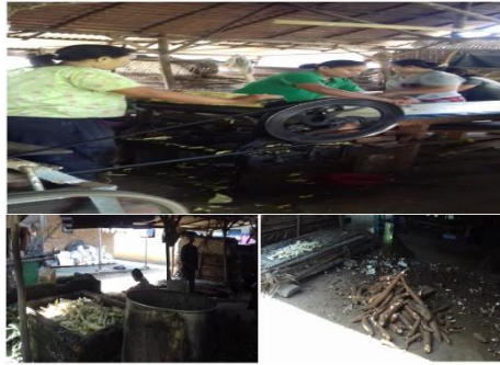
Gambar 2. Kondisi Eksisting UKM Opak Desi Medan

Kondisi eksisting dari UKM Opak Desi Medan, dilihat peralatan dan fasilitas UKM terlihat seadanya dan cenderung kotor, tidak ada jaminan keamanan dan kebersihan dari peralatan yang digunakan dalam proses produksi. Dapat dilihat pada gambar dibawah ini.