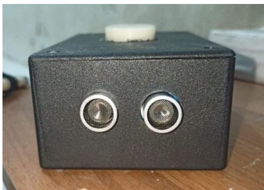
Gambar 2. Sensor Ultrasonik Dan GPS Berbasis Mikrokontroler

Setelah desain disusun, langkah berikutnya adalah perakitan komponen pada tongkat tunanetra. Sensor ultrasonik dipasang untuk deteksi rintangan di depan pengguna, dan modul GPS ditempatkan di posisi optimal untuk menerima sinyal satelit. Mikrokontroler dipasang sebagai pusat pengendali. Setelah perakitan selesai, komponen diuji untuk memastikan koneksi antar komponen berfungsi dengan baik.