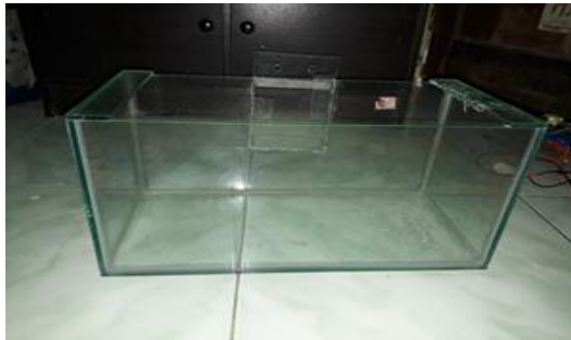
Gambar 2. Aquarium

mas terganggu akibat zat terlarut seperti lumpur menempel pada insang ikan, saat keruh akibat plankton persaingan oksigen pada saat malam hari membuat ikan kekurangan oksigen dan respon terhadap makanan menurun. akibat dari penglihatan yang terhalang. Kecerahan merupakan zona transparansi masuknya cahaya dan sumber tingkat kecerahan ikan. Jika terlalu cerah berdampak terhadap kualitas makanan alami berupa plankton untuk menambah nutrisi pada ikan. (Sumber : Novri_Syafwinta : 24 : 2017).