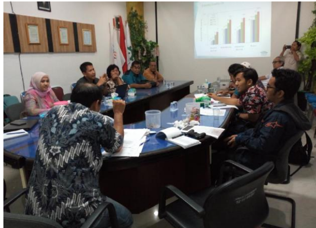
Gambar 3.3 Foto Peserta Pengabdian Kepada Masyarakat