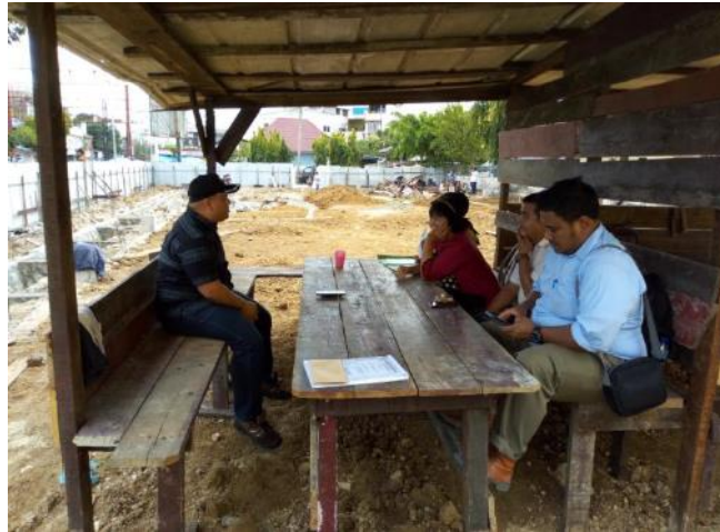
Gambar 3.2 Foto Lokasi Pasar Setelah Relokasi