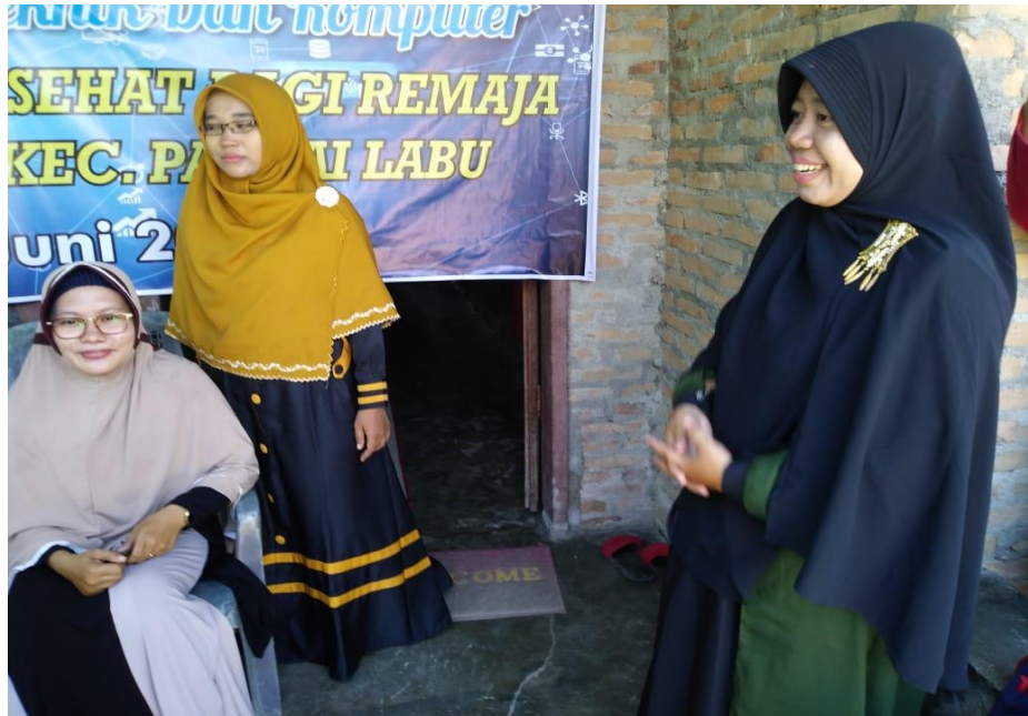
Gambar 3 Penyampaian Materi Internet Sehat