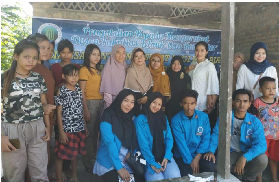
Gambar 2. Peserta Pengabdian Masyarakat

Selama proses kegiatan PKM berlangsung, secara umum para remaja sangat antusias dalam mengikuti kegiatan PKM ini, dimana terlihat saat mereka mengajukan pertanyaan-pertanyaan tentang bermedia sosial yang baik. Sehingga para remaja mulai memahami bagaimana mereka menggunakan internet yang sehat dan aman. Dengan demikian kegiatan PKM berjalan dengan efektif, seperti terlihat pada gambar di bawah ini: