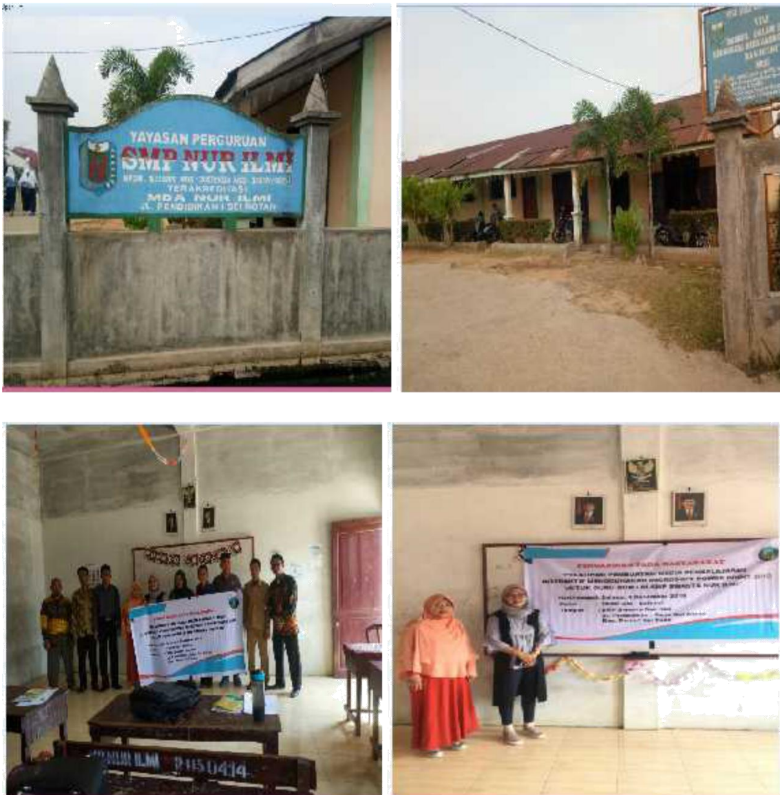
Gambar 2. Peserta Pengabdian Masyarakat

perkembangan teknologi, sehingga para guru tersebut bisa memanfaatkan teknologi untuk meningkatkan kualitas pembelajaran yang diberikan kepada siswa, salah satunya yaitu dengan membuat media pembelajaran interaktif menggunakan Ms.PowerPoint 2010 . Selama proses pelatihan pada kegiatan PKM, secara umum para guru telah mengetahui dasar-dasar penggunaan aplikasi Ms. PowerPoint , sehingga para guru mampu menerapkannya dalam pembuatan media pembelajaran, seperti pengenalan materi dan tools powerpoint , memasukkan teks dan gambar, memasukkan audio dan video, membuat navigasi, membuat hyperlink dan membuat animasi. Pelaksanaan PKM diakhiri dengan melakukan praktek langsung pembuatan media pembelajaran interaktif menggunakan powerpoint secara mandiri dibawah bimbingan tim pengabdian. Dengan demikian kegiatan PKM berjalan dengan efektif, seperti terlihat pada gambar di bawah ini: