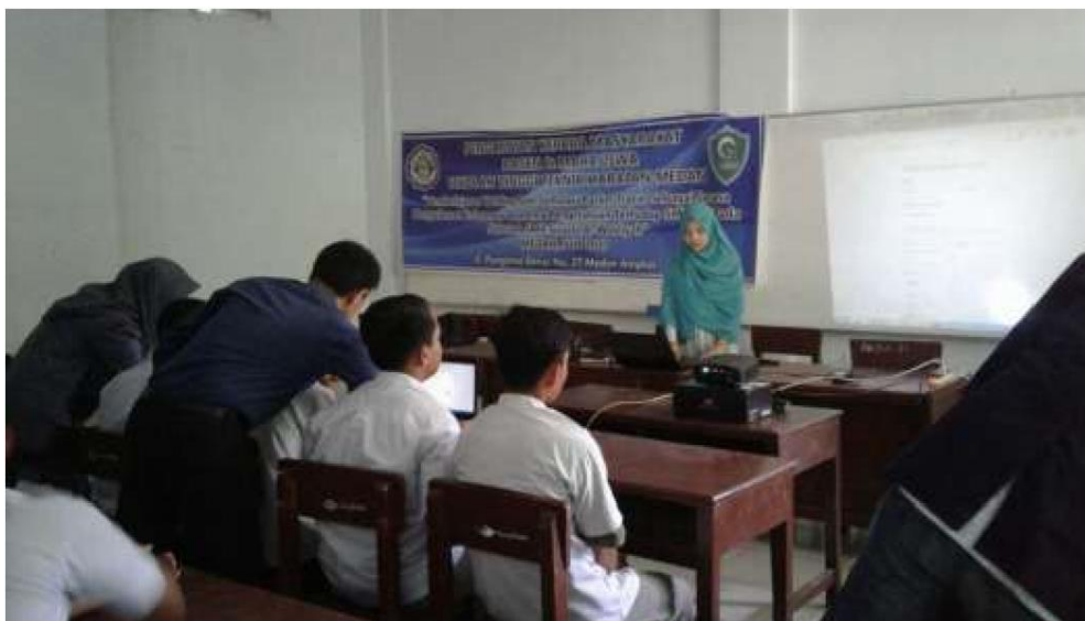
Gambar 1 Pembelajaran Web Blog

Hasil dari pembelajaran web blog dapat dilihat pada gambar berikut.