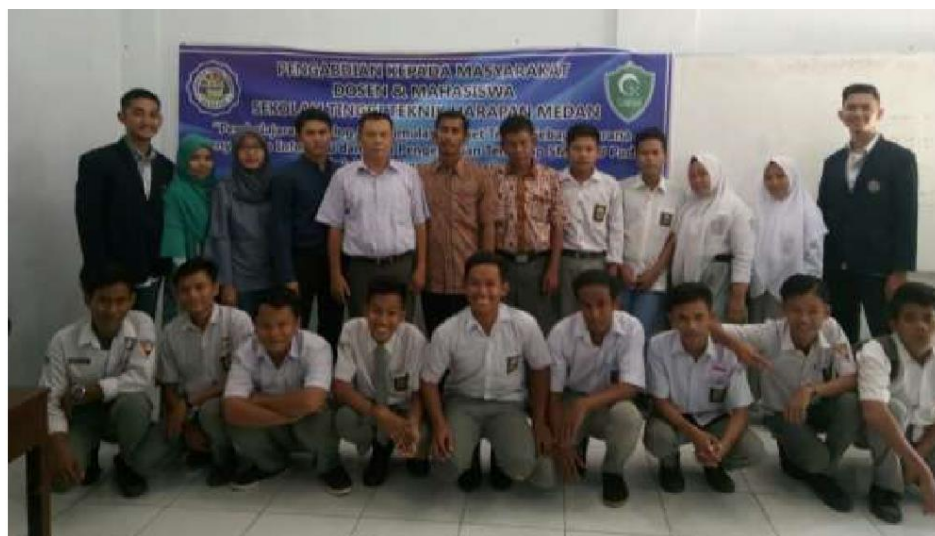
Gambar 5 Foto Bersama dengan siswa/i SMK swasta Al-Washliyah