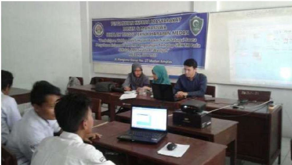
Gambar 3 Pembelajaran Packet tracer

Hasil dari penerapan simulasi jaringan nirkabel pada packet tracer dapat dilihat pada gambar berikut.