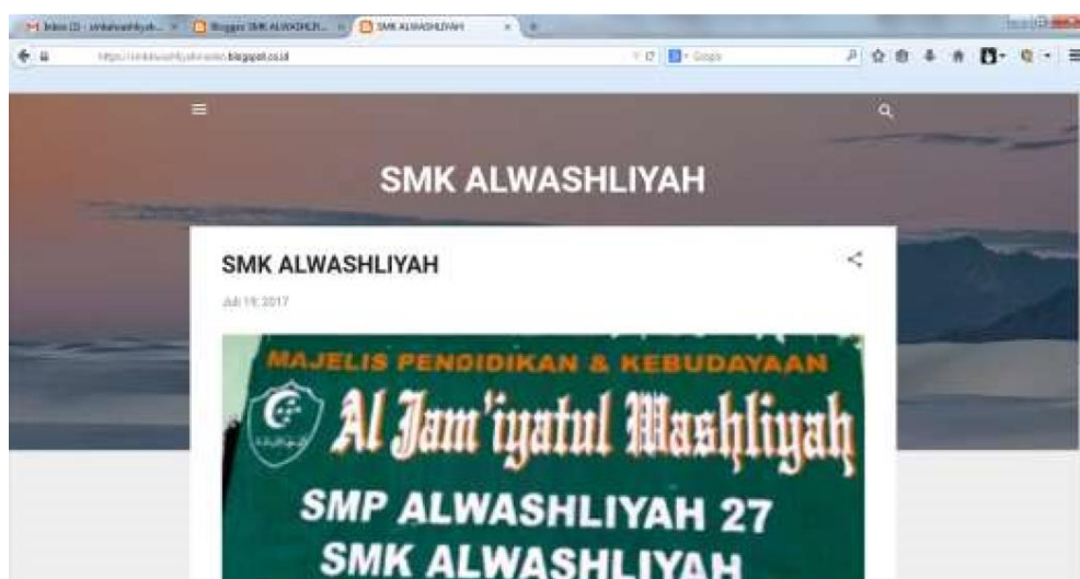
Gambar 2 Hasil Pembelajaran Web Blog

Hasil dari pembelajaran web blog dapat dilihat pada gambar berikut.