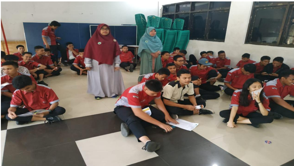
Gambar 2. Peserta Pengabdian Masyarakat