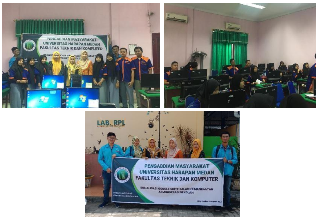
Gambar 1. Dokumentasi Kegiatan

Kegiatan pengabdian ini dilakukan dengan mengambil narasumber yang merupakan dosen dari Prodi Sistem Informasi Fakultas Teknik dan Komputer Universitas Harapan Medan. Kegiatan pengabdian masyarakat di lingkungan SMK Swasta Mandiri Percut Sei Tuan dapat diselenggarakan dengan lancar. Kegiatan ini mendapat sambutan yang sangat baik.