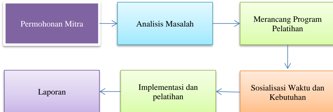
Gambar 1 Tahapan Pelaksanaan Kegiatan

Pelaksanaan pengabdian masyarakat dilaksanakan berdasarkan kerjasama Desa Sei Limbat dengan tim pengabdian masyarakat. Lokasi mitra berada di Kecamatan Selesai, Kabupaten Langkat, Sumatera Utara.. Dosen membuat tim untuk menganalisis dan membuat program untuk pelatihan. Adapun tahapan pelaksanaan disajikan pada Gambar 1.