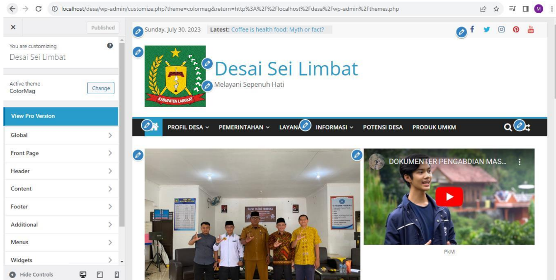
Gambar 5 Penyesuaian Tema

Pada Gambar 5, terlihat adanya ikon pensil yang digunakan untuk melakukan perubahan dan penyesuaian konten. Pelatihan fokus pada mengajarkan bagaimana menyesuaikan halaman depan website. Halaman depan ini berfungsi sebagai wadah untuk menyampaikan informasi umum tentang Desa Sei Limbat. Karena halaman depan menjadi representasi pertama yang dilihat oleh pengunjung, penting untuk memastikan tampilannya memukau dan menarik perhatian. Setelah menyesuaikan Tema, langkah selanjutnya adalah memasukan produk UMKM pada website yang dirancang. Berikut hasil perancangan seperti terlihat pada Gambar 6 berikut.