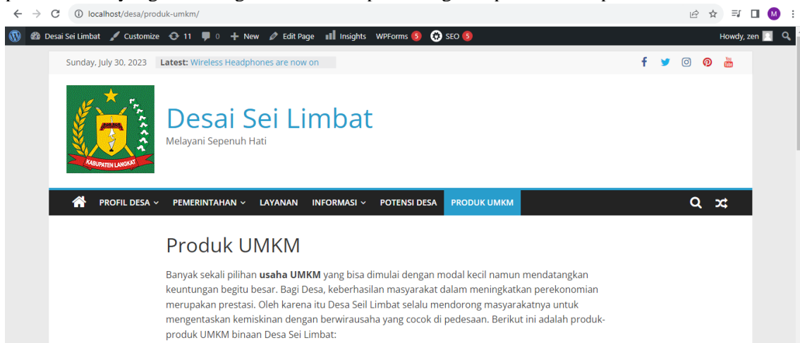
Gambar 6 Halaman UMKM

Pada Gambar 5, terlihat adanya ikon pensil yang digunakan untuk melakukan perubahan dan penyesuaian konten. Pelatihan fokus pada mengajarkan bagaimana menyesuaikan halaman depan website. Halaman depan ini berfungsi sebagai wadah untuk menyampaikan informasi umum tentang Desa Sei Limbat. Karena halaman depan menjadi representasi pertama yang dilihat oleh pengunjung, penting untuk memastikan tampilannya memukau dan menarik perhatian. Setelah menyesuaikan Tema, langkah selanjutnya adalah memasukan produk UMKM pada website yang dirancang. Berikut hasil perancangan seperti terlihat pada Gambar 6 berikut.